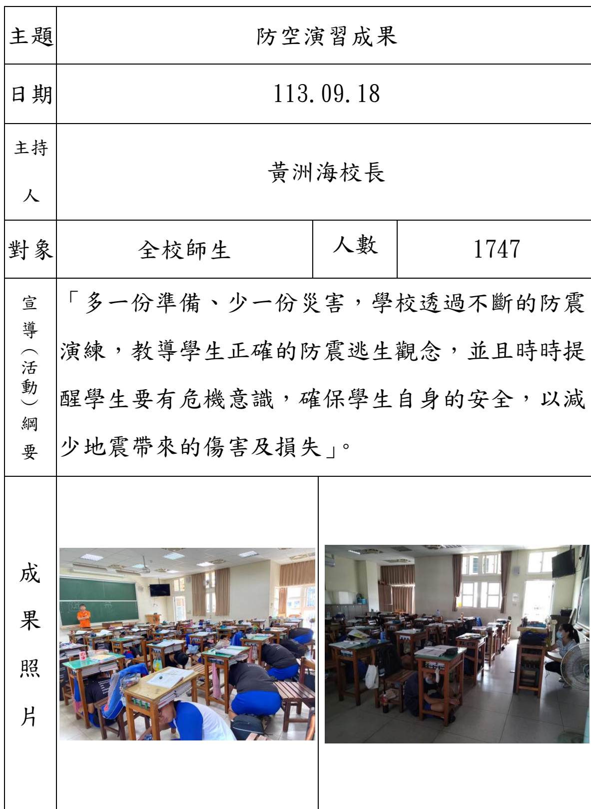
彰化縣二林高中 113 年全民國防教育宣導教育活動資料紀錄表