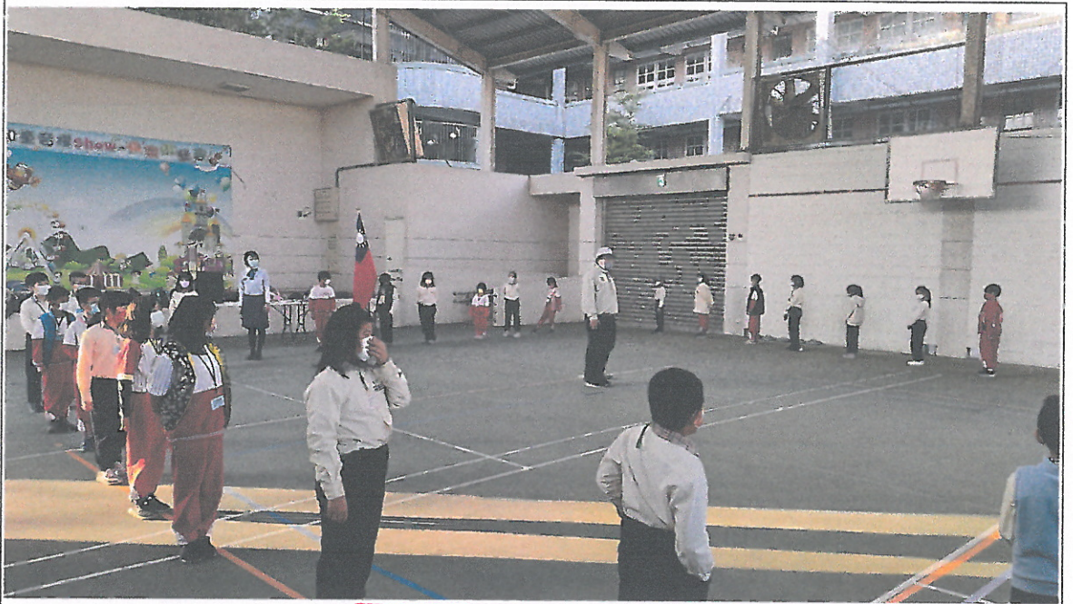
▲於童軍團的舉辦指導敬愛國家觀念