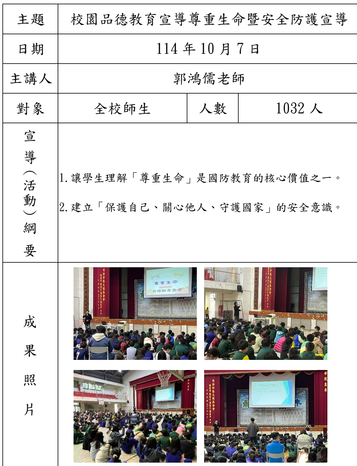
彰化縣永靖國民小學 114 年全民國防教育宣導教育活動資料紀錄表

附件二-3 (至少三項活動，一為配合全民國防教育日，一為防空演習，另一為平時宣導)